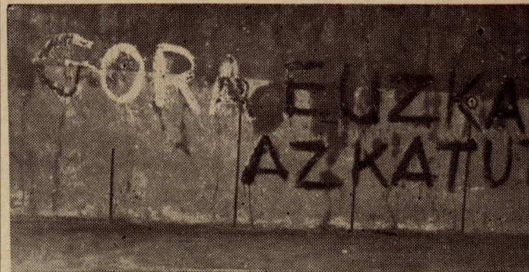
El frontón de Zaldondo (Alaba), después de la pasada de los gudaris de Euzko Gaztedi el 20 de febrero, de la que dimos amplia información en nuestro número de marzo.

Redacción y Administración FLORIDA 461 — Buenos Aires