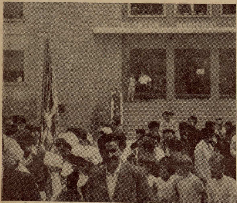
Con ocasión de la fiesta del "jumelage" entre Estella y Saint Jean Pie de Port, celebrada el 17 de setiembre pasado, los dantzaris bajonavarros pasearon por Estella la bandera vasca. En la foto de arriba podemos ver la ikurriña, en el centro, a la salida del Frontón Lizarrá, rodeada por las autoridades de ambas ciudades. En la de abajo vemos a los dantzaris estellicas y bajonavarros en kalegira con la bandera de Euzkadi.