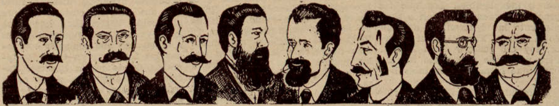
LOS MARTIRES DE CHICAGO: Spies, Ling, Parsons, Fielden, Neebe, Fischer, Schwab y Engel, en cuya memoria se instituyó en todo el mundo el PRIMERO DE MAYO.

AÑO XV - BUENOS AIRES, CARACAS MEXICO, MAYO DE 1971 - Nº 179