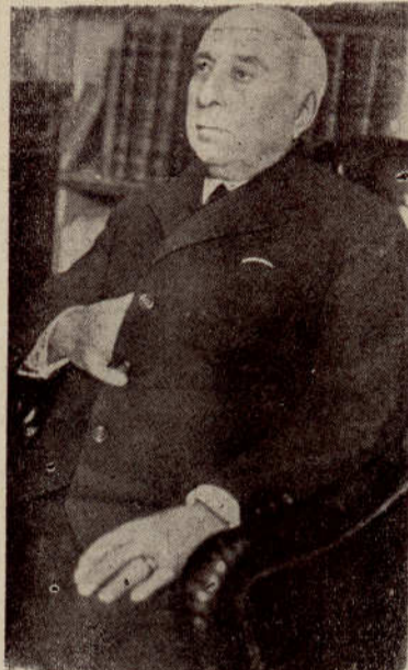
Euskara, cuyo lema era Zazpiak Bat y su órgano la Revista Euskara.

Del libro recién editado dice el prologoista: "Navarra en su vida histórica" es una obra genial, que difícil parece pueda ser superado. En ella, el artista, el historiador y el político encuentran en Campión un maravilloso realizador."