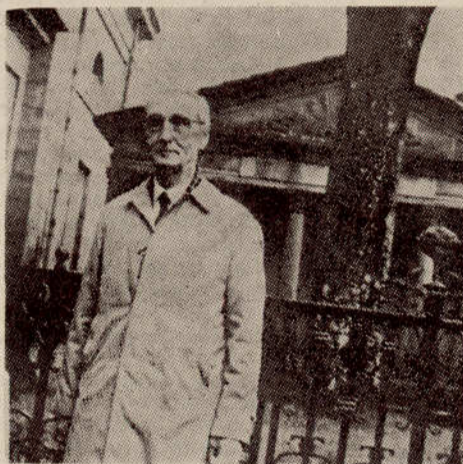
Testimonios de la presencia del Lendakari Leizaola en Gernika en Abarri-Eguna 1974 ante el Arbol de la Libertad y en la Casa de Juntas rodeado de patriotas.