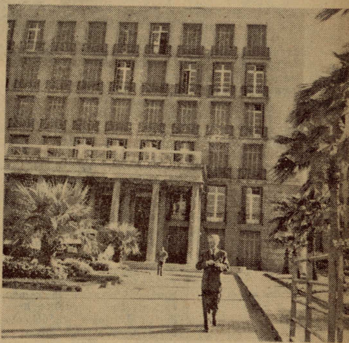
Sjukhusets fasad är imponerande — det som finns därbakom går kanske alltigenom inte i samma stil.

Rummen är luftkonditionerade, har telefon och radio, och är dessutom i regel så stora, att patienterna kan ha hela sin familj på besök om de så önskar. Och det önskar de ofta! Då sjukhuset planerades ritades rummen med tanke på europeiska förhållanden, dvs. de gjordes icke överdrivet stora. Senare har man emellertid fått slå ihop rummen två och två, den ur-