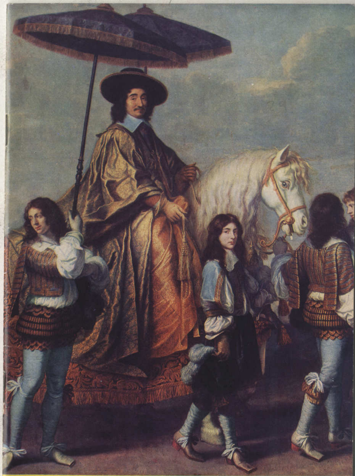
L'entrée du Chancelier Séguier à Rouen après la révolte de 1639 — Tableau de Charles Le Brun — Musée du Louvre.