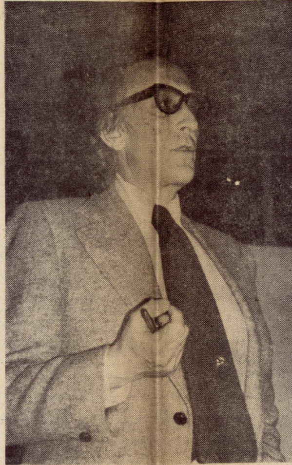
John Friedmann, "todos a planificar".

Ese hombre de la calle se queja de su ciudad en el noventa y nueve por ciento de los casos. También aquí, en Pamplona, y con razones sobradas.