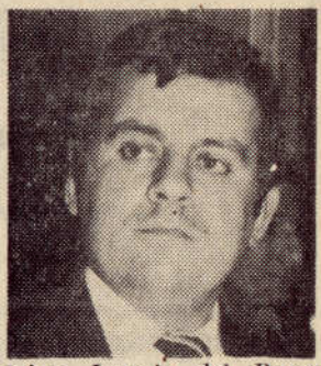
Jaime Ignacio del Burgo, abogado y tratadista foral.