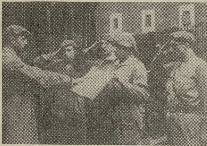
Don Javier, bajo el árbol de Guernica, jura los fueros vascos.

Hay episodios de la última guerra civil española que aún permanecen ocultos. Se ha dicho que, a pesar de los miles y miles de volúmenes publicados sobre el tema, todavía no se ha escrito la verídica, total y gran historia de aquella guerra.