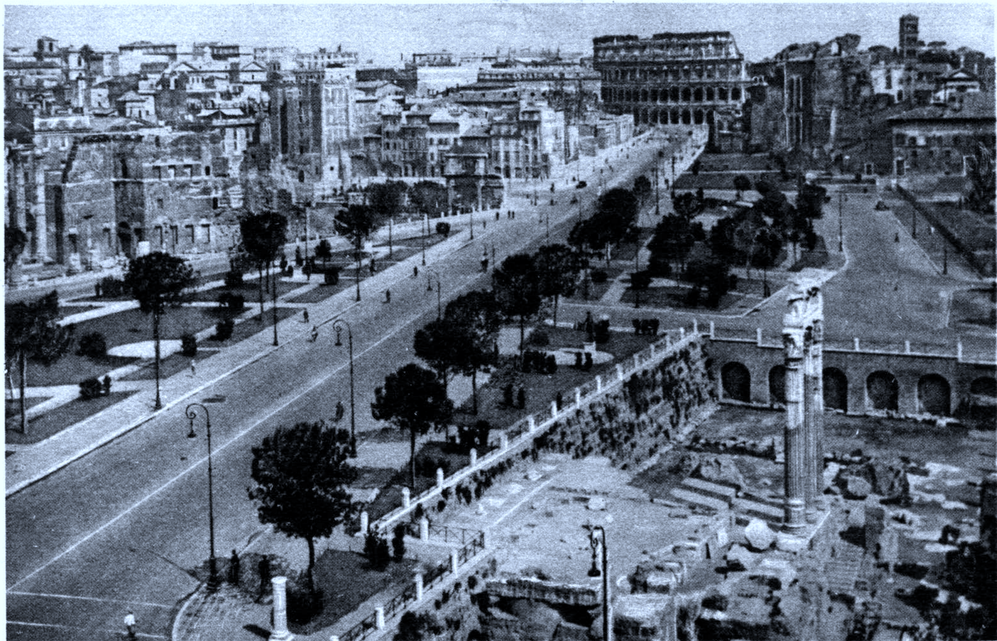
Roma - Via dell'Impero