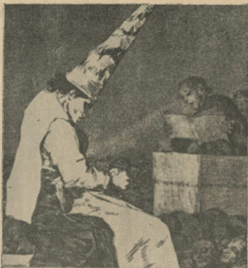
"Capricho", de Goya

La Reconquesta, en els quatre primers segles, no tingué encara el caràcter de guerra religiosa i en el segle XI semblava que s'anava a resoldre harmònicament la convivència, tributaris com eren els reis de taifes dels regnes del nord i respectant els reis cristians l'exercici de la religió dels musulmans i dels jueus en els territoris reconquistats. Amb el domini musulmà, però, s'havia d'intensificar el percentatge de sang africana en la població espanyola, i la política desastrosa d'Alfons VI de Lleó ho posà tot en perill, provocant la crida dels almoràvids als quals seguiren aviat els almohades, ambdós grups procedents dels musulmans africans més fanàtics que perseguiren els seus propis correligionaris, els quals, sovint, trobaren protecció i refugi a Barcelona i Toledo, fecundant la cultura espanyola i, àdhuc, tota l'europea. Al mateix temps, però, arriba a Espanya l'esperit de les croades, donant a la Reconquesta una aparença de guerra religiosa que fins aleshores no havia tingut essent tan sols una lluita pel poder o per la possessió de territoris. Efectivament; davant del perill musulmà que es recruava per Europa —els seldjucides a Orient i els almoràvids a Occident— els països cristians es disposaven a defensar-se prenent l'ofensiva; la lluita a Espanya fou considerada una croada el mateix que la de Palestina. En arribar els monjos de Cluny a Espanya, es van adaptar a la tradició política de l'església visigòtica continuada pels bisbes i abats guer-