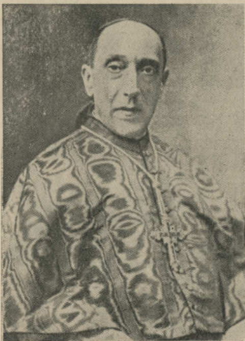
Cardenal Vidal i Barraquer

L'obsessió de mantenir la lletra en detriment de l'esperit sembla estar en franca decadència. Han estat anul·lades les excomunicacions del temps del Cisma d'Orient; el Papa ha fet oració conjunta amb el Patriarca ortodox grec, amb un ministre metodista i amb l'arquebisbe anglicà Ramsey; Galileu —que havia estat perseguit per la Inquisició— ha estat justificat, s'han suprimit l'índex de llibres prohibits i el Sant Ofici. Joan XXIII proclamà que l'Església, més que condemnant, haurà de fer prevaler el mètode de l'amor, de la misericòrdia i de la pobresa evangèlica —l'"Església dels pobres". Ara es torna a complir el que Crist