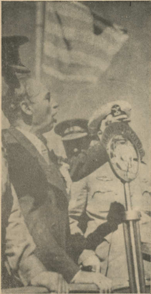
Lluís Companys, s'adreça als soldats catalans

ceps protestants com Jaume I d'Anglaterra. La nova doctrina de les relacions amb l'Estat i amb els partits polítics —amb esferes d'acció diferents de les de l'Església— de Pau VI i del Concili Vaticà II, l'ha caracteritzada perfectament el bisbe mexicà Méndez Arceo, de Cuernavaca, amb paraules justes: “Una clara distinció entre la sociedad civil y la Iglesia. El fin de la sociedad civil es procurar el bien común