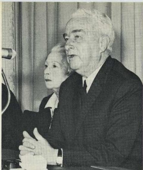
M. Louis Joxe président l'Assemblée Générale des Amis de la République Française.