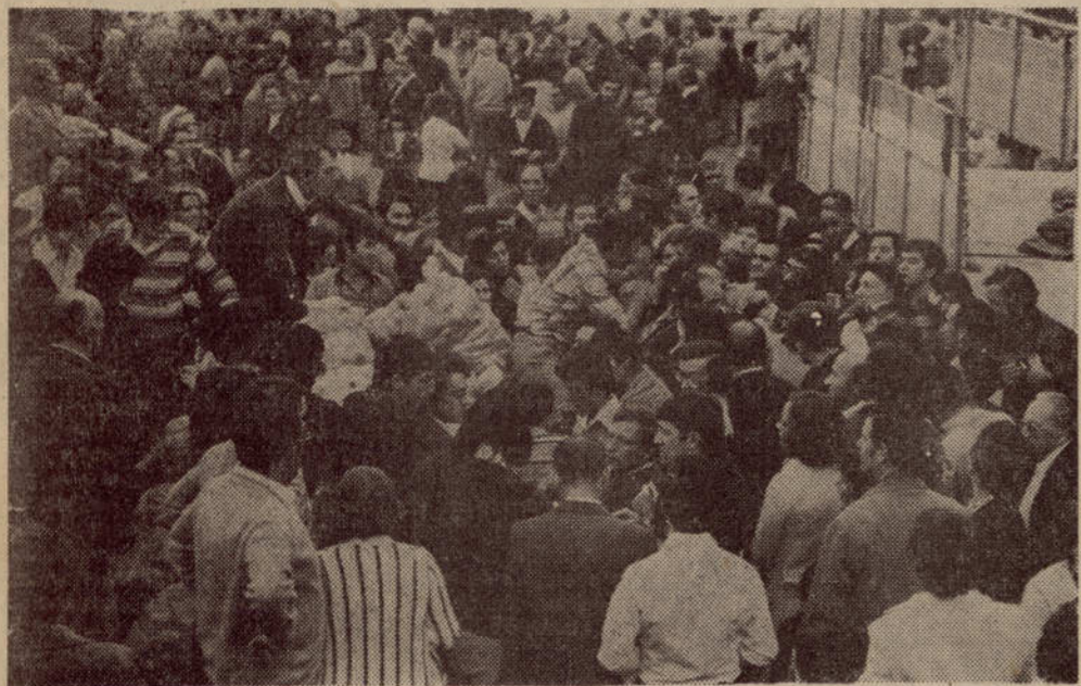
Los compradores se agruparon junto a las mercancías sin dar margen a los organizadores para controlar las ventas. Esta escena de Barañáin se repitió en casi todos los puntos.