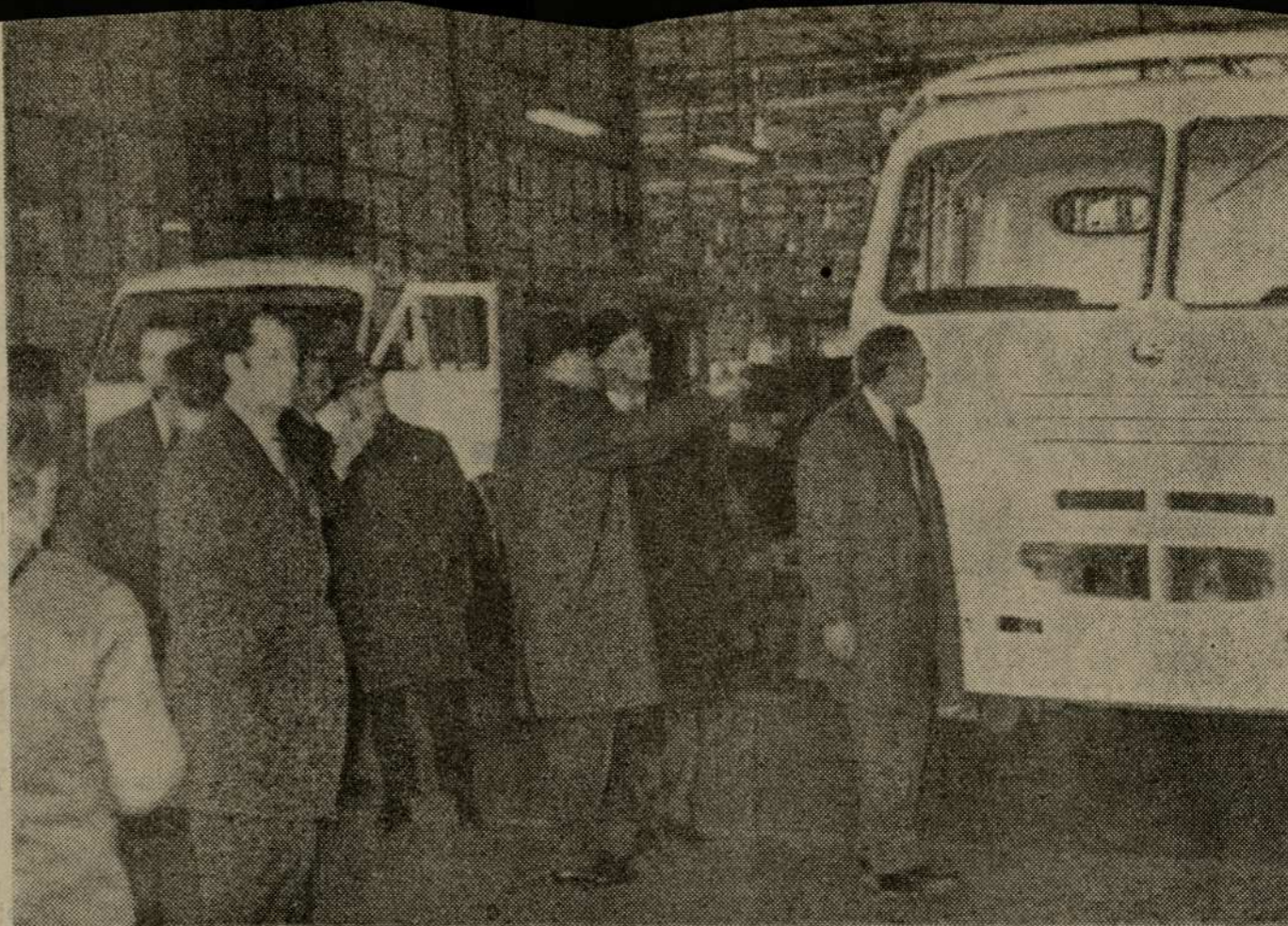
Varios miembros de la Misión Polaca de Cooperación Industrial se encuentran en España. Ayer visitaron las instalaciones de la Empresa Nacional de Autocamiones «Pegaso», uno de cuyos momentos recoge la fotografía.

Coblenza. Según las últimas noticias más de veinte trabajadores han muerto y el número de heridos se eleva a catorce.