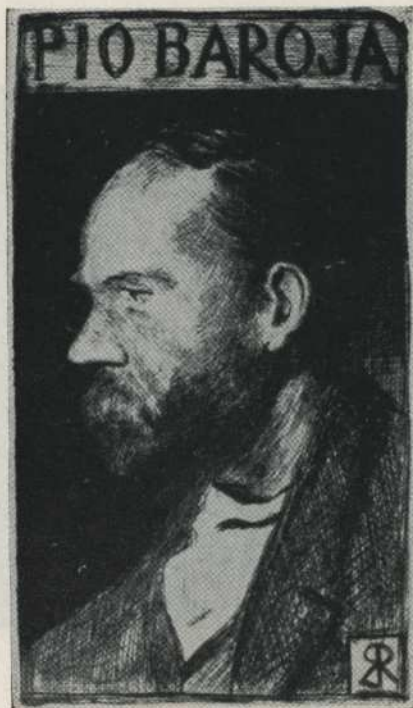
PIO visto por RICARDO (Año 1901)