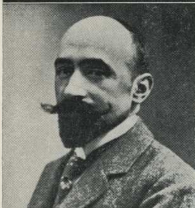
JACINTO BENAVENTE nada mefistofélico, no obstante su acusado aire demoníaco.