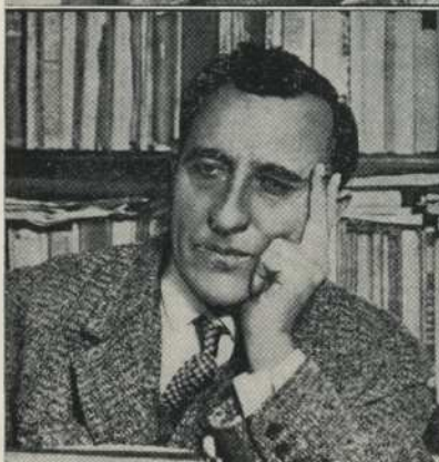
RAMIRO DE MAEZTU siempre luciendo una encrespada y encrestada suficiencia.