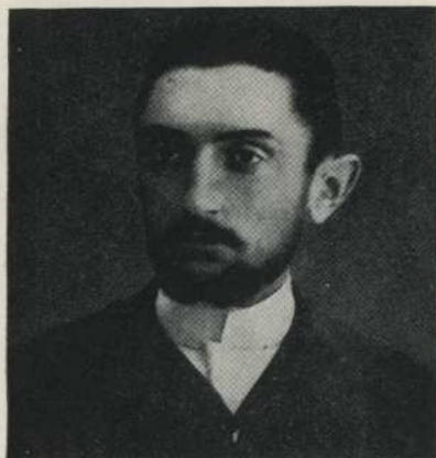
MIGUEL DE UNAMUNO en 1898, ya enemigo declarado de la corbata.