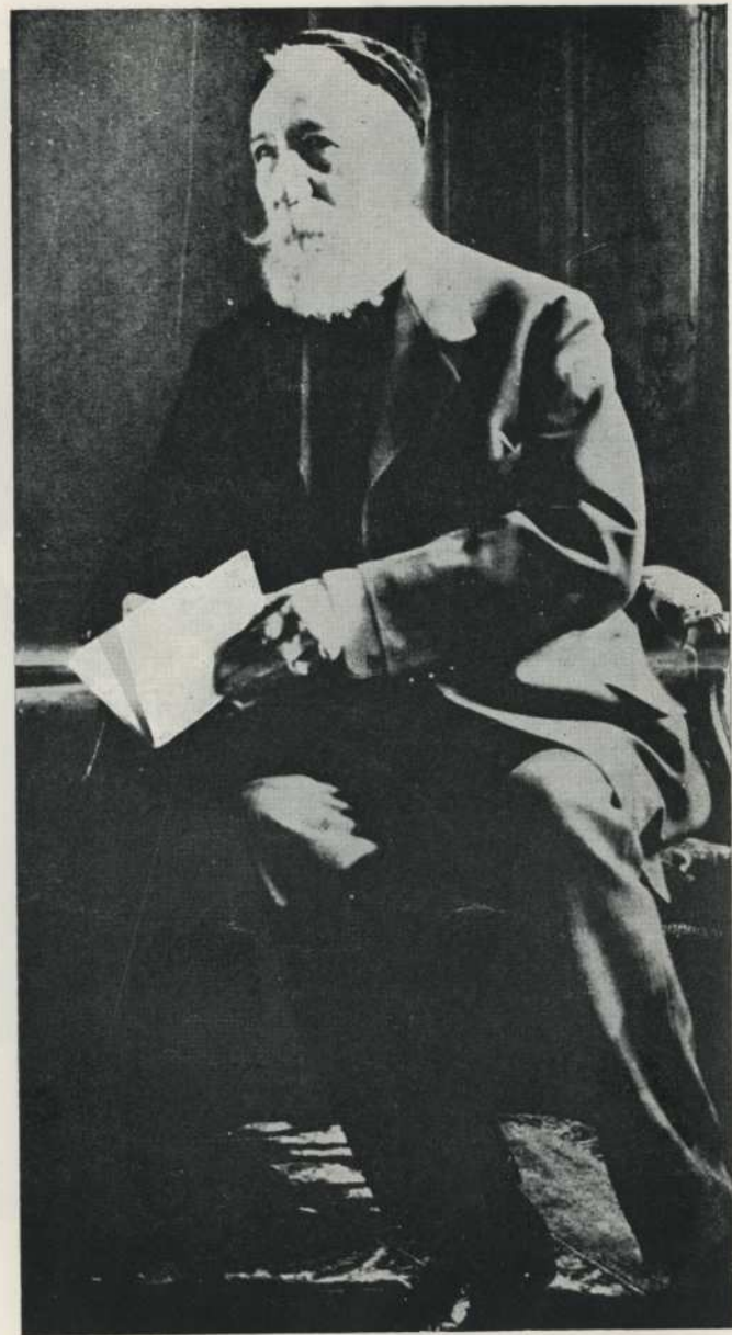
ANATOLE FRANCE 1844-1924