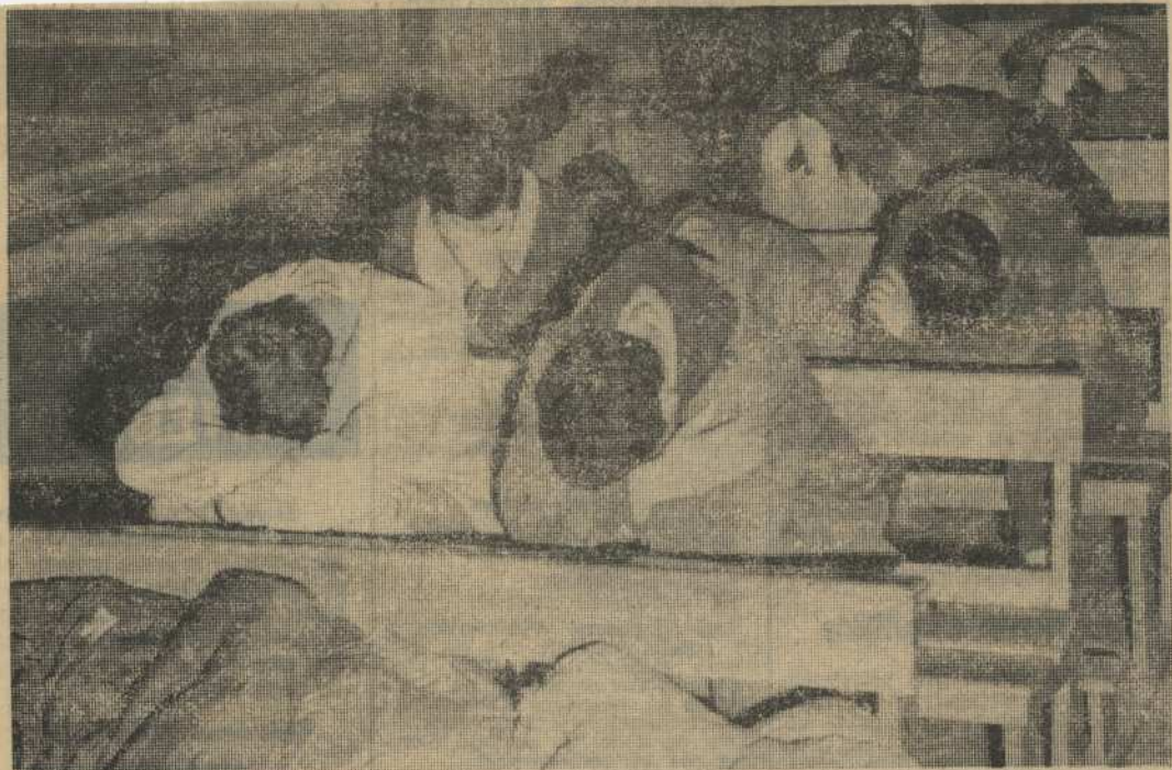
Voici le groupe de réfugiés politiques basques qui avait entamé samedi matin, vers 10 heures une grève de la faim illimitée. Ils devaient être expulsés hier soir par la police. (Voir dernière page)