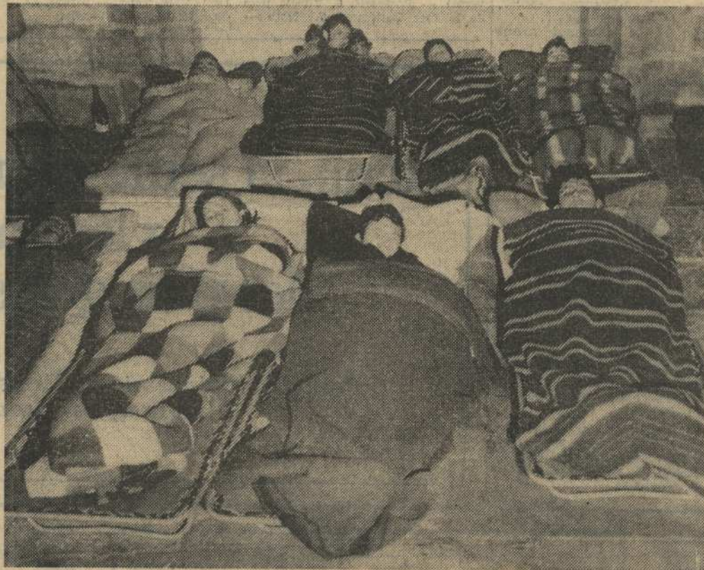
Le groupe des grévistes a nouveau installé dans une chapelle du fond de la cathédrale, mardi matin. A 13 h 15, ils seront expulsés et gardés à vue au commissariat.

Pour la deuxième fois, les grévistes étaient expulsés et conduits au commissariat de police. Les lits de camp et les couvertures étaient emportés. Deux grévistes, qui se trou-