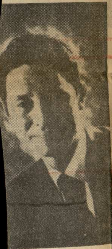
y a un inglés. Los ameri- recha), de IBM. El inglés RIO DE NAVARRA).