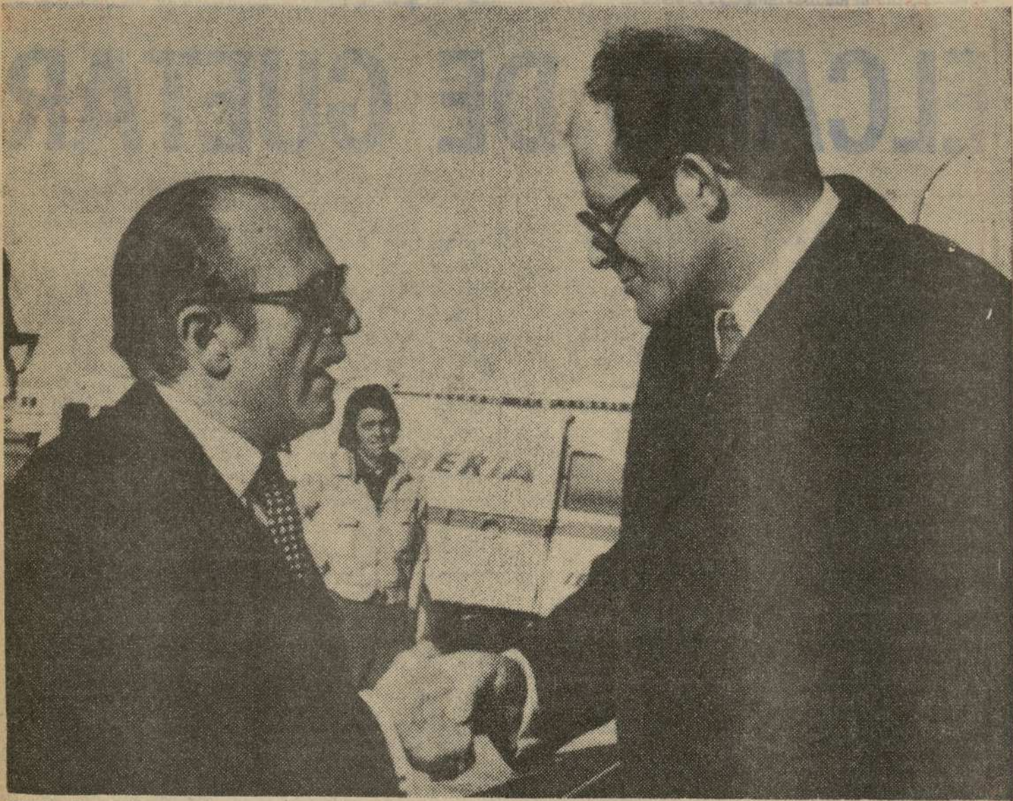
El Sr. Peter Lorf, primer embajador de la República Democrática Alemana en España (derecha), a su llegada al aeropuerto de Barajas donde fue recibido por altos funcionarios del Ministerio español de Asuntos Exteriores. — (Unifax Cifra-DIARIO DE NAVARRA).