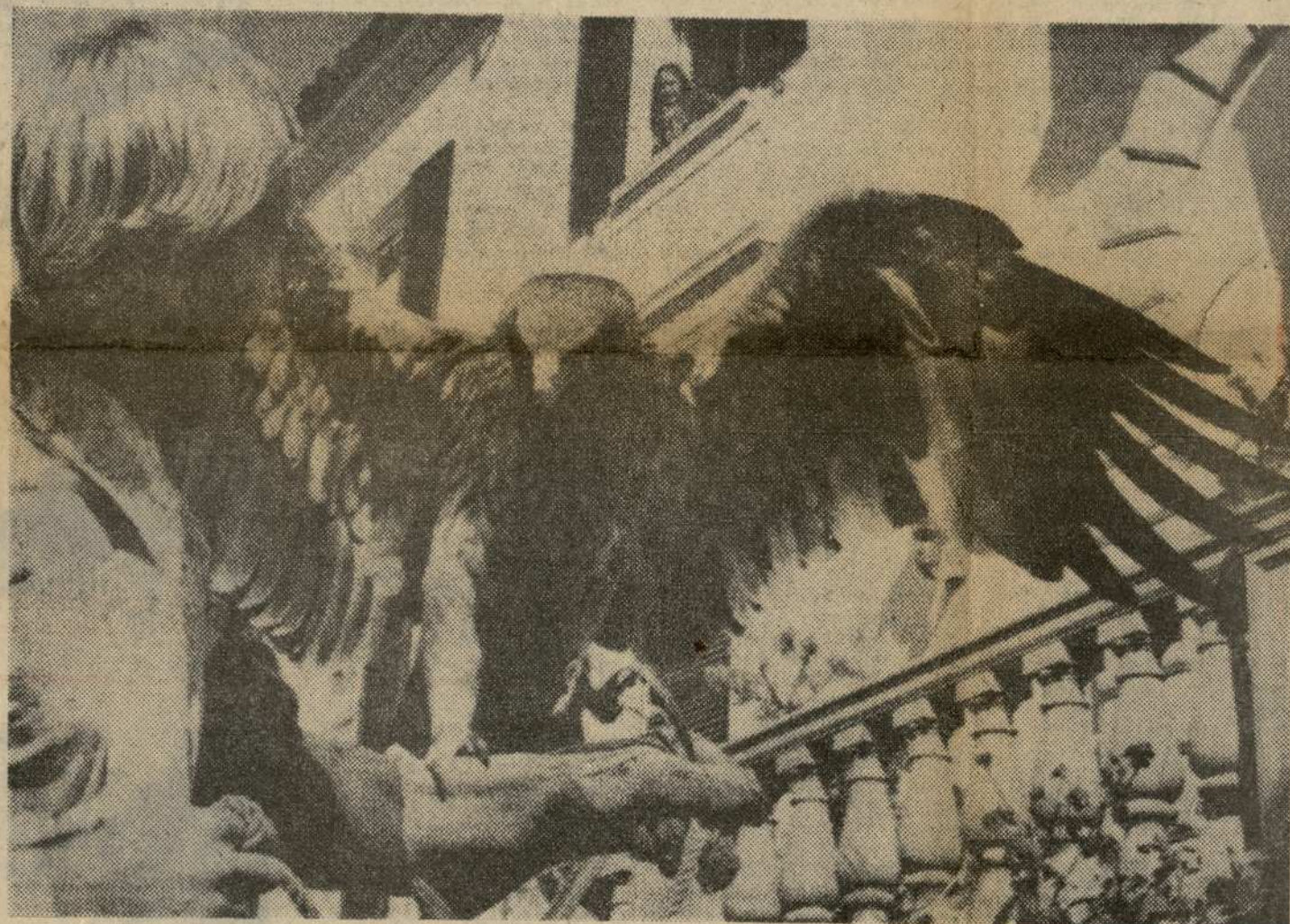
El ornitólogo norteamericano Clifford Lindquist, sostiene en su brazo un ejemplar de águila imperial española que fue llevada subrepticamente a los Estados Unidos tras ser capturada en una reserva de nuestro país. Tras la denuncia correspondiente por parte de las autoridades españolas el águila imperial va a ser devuelta a España. Se calcula que sólo quedan 100 ejemplares de esta especie en nuestro país.