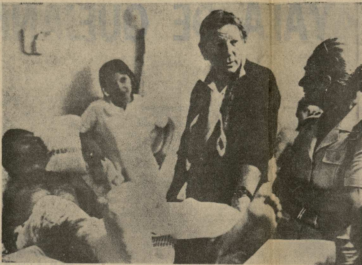
El actor norteamericano de origen judío Danny Kaye, conversa con un soldado israelí herido en un hospital de Tel Aviv. Danny Kaye ha llegado a Israel para contribuir con su actividad artística al esfuerzo bélico del pueblo judío. — (Unifax Cifra-DIARIO DE NAVARRA).