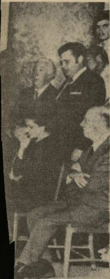
gne músico, durante la uerto Rico en memoria y Cataluña.