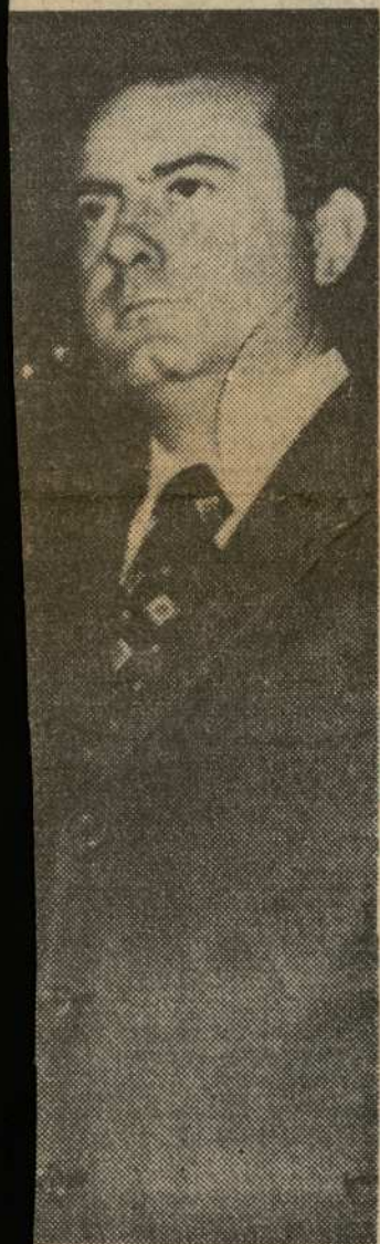
rnández Miranda, du- legados Nacionales de O DE NAVARRA).