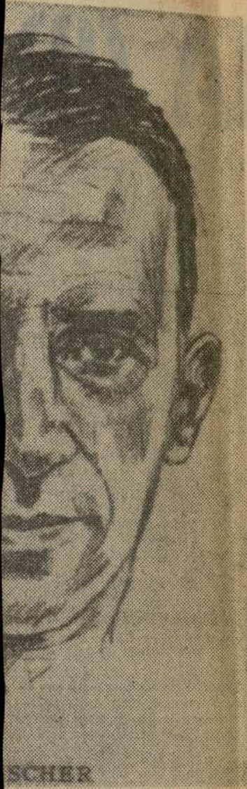
SCHER Química. A la derecha el quierda el Prof. Geoffrey E NAVARRA).