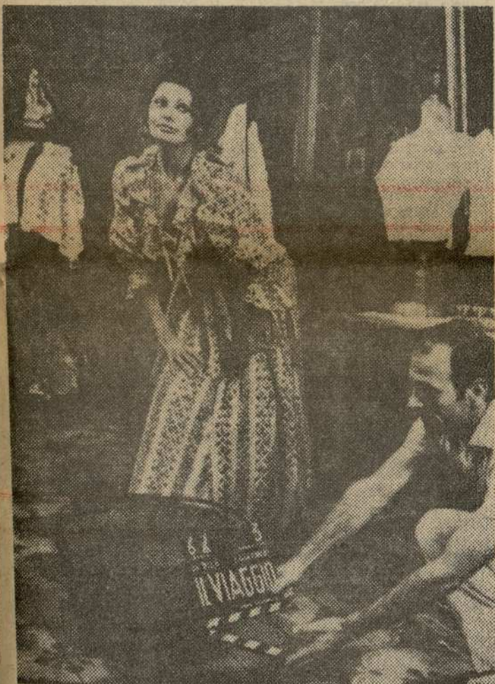
La actriz italiana Sofia Loren espera instruccio- nes para interpretar una escena de la película «Il Viaggio», dirigida por Vittorio de Sica, que está rodándose en la localidad de...