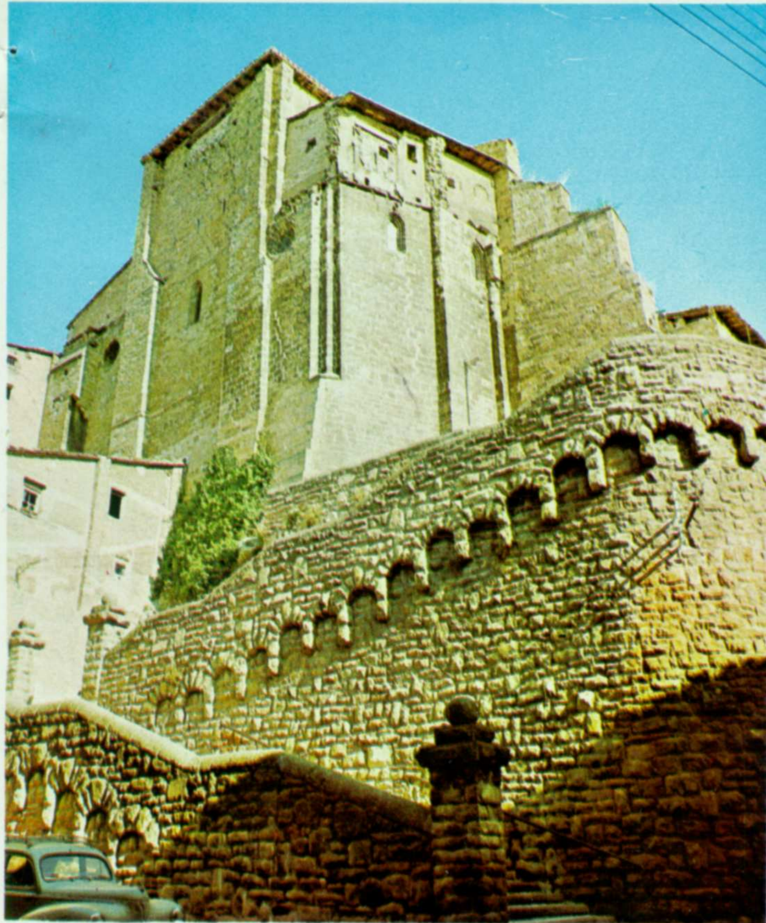
IGLESIA DE SAN MIGUEL

Santa Clara. Influyó poderosamente para su fundación, en 1253 la hija de San Luis, rey de Francia, esposa de Teobaldo II. La iglesia fue reedificada en 1289 y restaurada en el XVII. En este monasterio se educaban las infantas navarras en el siglo XIV.