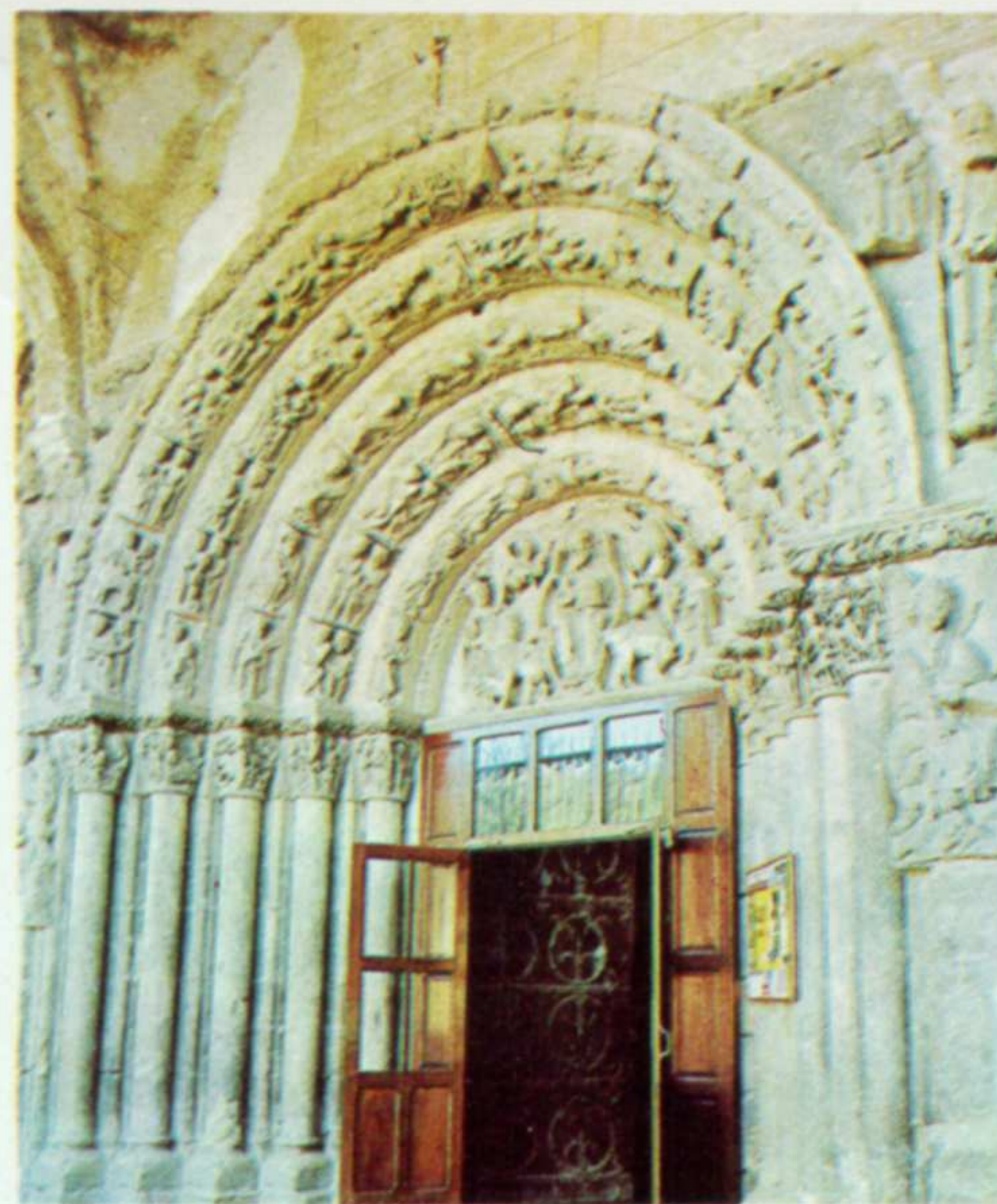
PORTADA DE SAN MIGUEL

Convento de Santo Domingo. Fundado por Teobaldo II de Navarra en 1259. Gótico primario, levantado en el punto en que anteriormente se