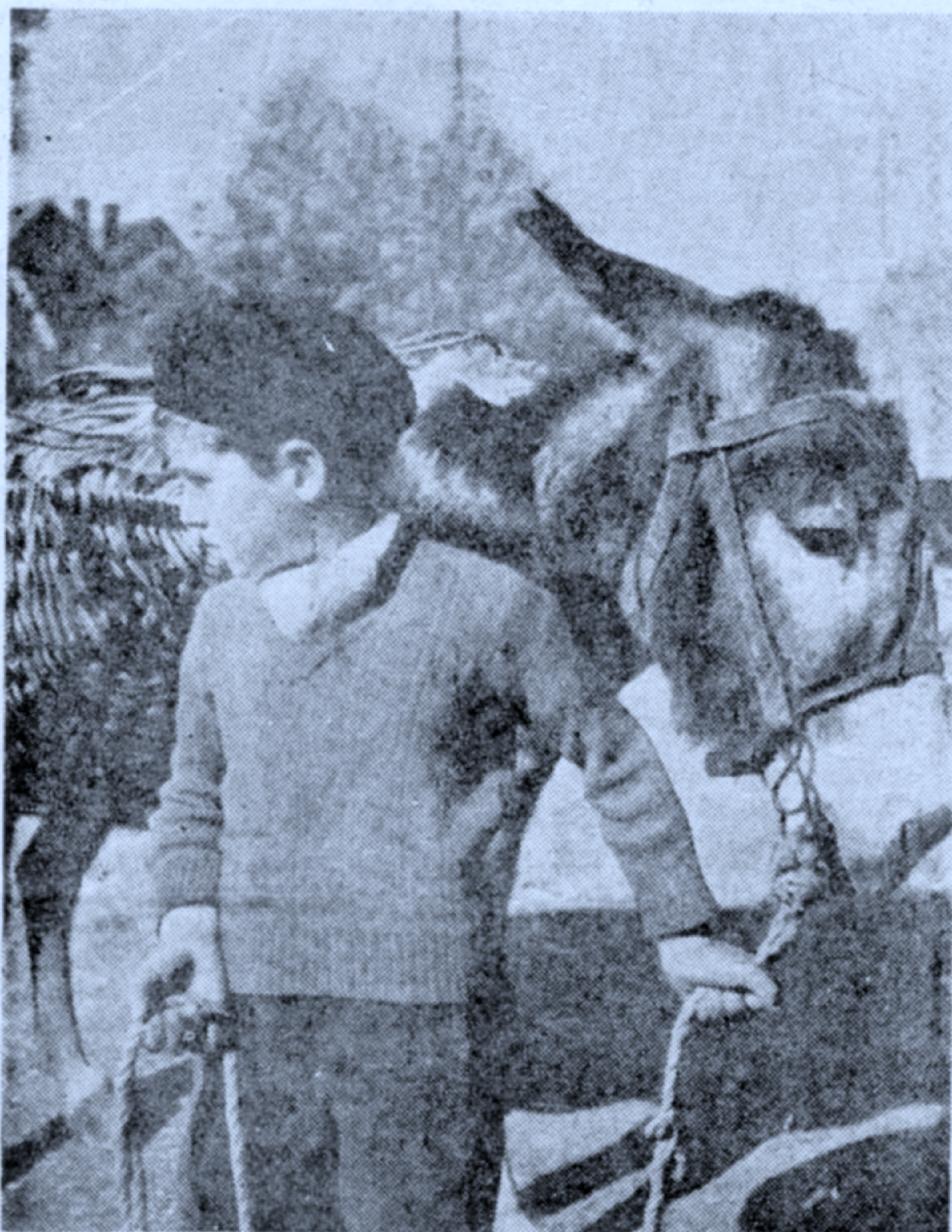
Un mocete de la Baja Navarra vigila la venta, en el mercado de San Juan de Pie del Puerto