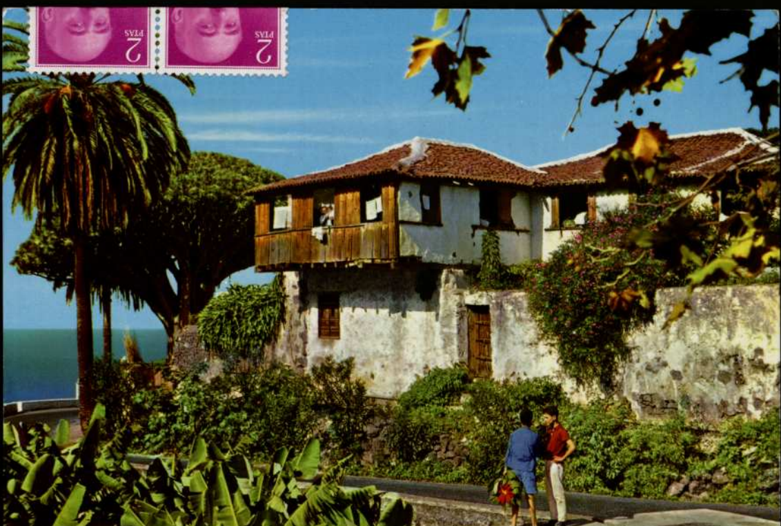
A typical dwelling, Tenerife, Canary Islands.