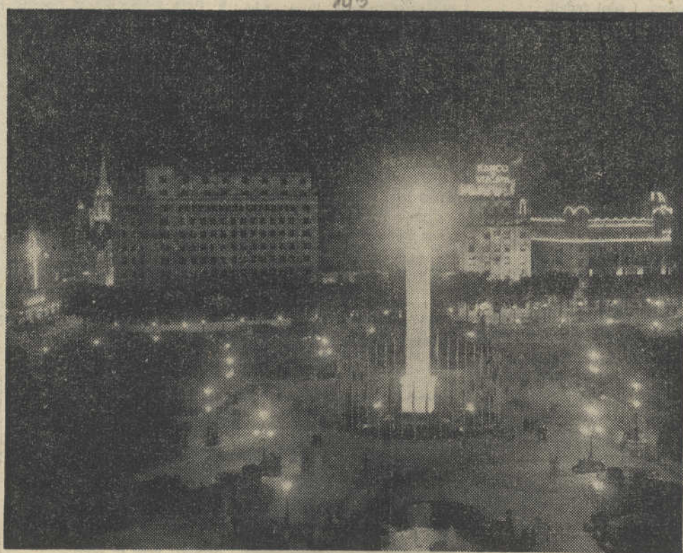
Intorno alla gigantesca Croce alta 30 metri che si erge nella Plaza de Cataluña a Barcellona, che è la più grande piazza di tutta la Spagna, sono le bandiere delle Nazioni rappresentate al Congresso Eucaristico

2 - Junio - 52 - El Popolo (dem. crist) que por su parte, no debe ea, > casi obvuda o munitiza, las presencias gubernativas