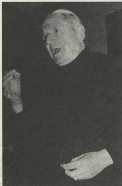
No queremos recibir arrodillados indultos concedidos con cuentagotas

G.—Hemos tocado el movimiento de alcaldes. ¿Qué opinión le merecen los acontecimientos de Etxarri-Aranaz?