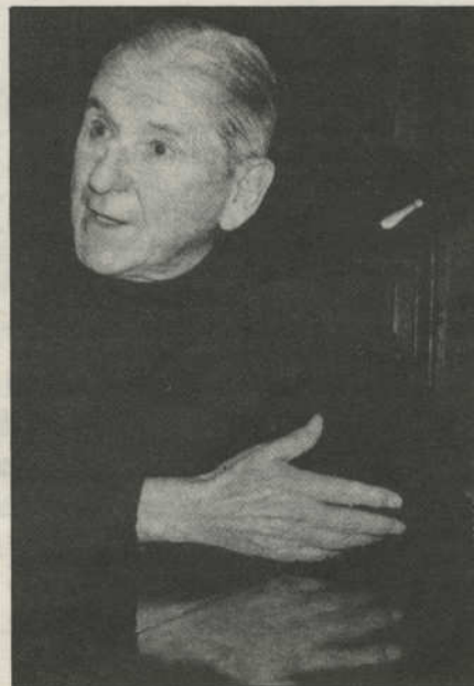
Lo de Yeu es un flagrante atentado contra los derechos humanos

T. M.—Aunque hemos hablado antes del tema, quisiera terminar extendiendo los brazos a todos los hombres y todos los pueblos oprimidos por la falsa política de un Estado español artificial, haciendo una llamada emocionada a todos en el intento de olvidar el pasado y de reconstruir un futuro de convivencia mutuamente acordada, en la que predomine la fraternidad y la unión.