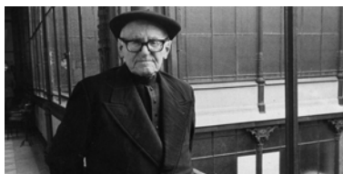
José Miguel Barandiaran