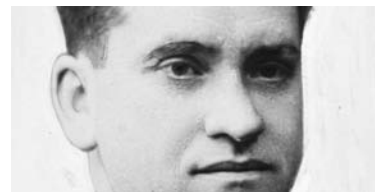
Manuel de Irujo