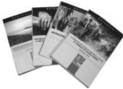
Martxoan argitaraturiko lau liburuen azalak.

fluencias antropológicas" son los títulos de Zainak 19 y 20, Cuadernos de Antropología-Etnografía. Por último, se presentó el número 30 de Vasconia, Cuaderno de Historia-Geografía "Lana Euskal Herrian. El trabajo en Vasconia" reü-