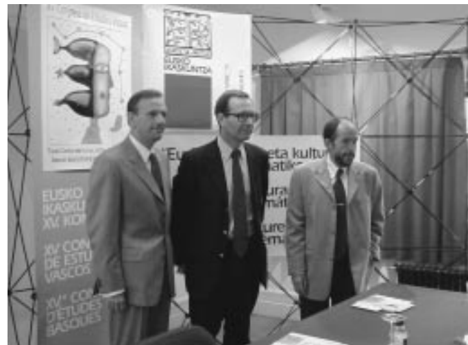
El XV Congreso de Estudios Vascos se presentó en rueda de prensa.