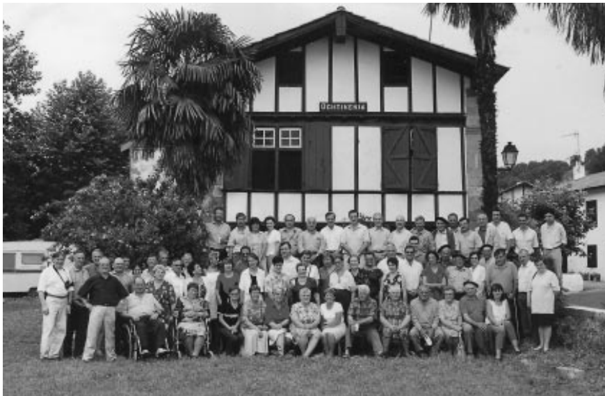
Oxtikenea, 1999.07.11 Igo Kantu zaharraren eguna.

Senpereko kantu zaharrak da Lankidetzan Bildumaren azken argitalpenaren izenburua. Bertan, XIX. eta XX. mendeetan zehar Senpereko bizimoldea, historia eta tradizioak islatzen dituzten 71 kanta herrikoi bildu dira. “Erronda eta eskekoak”, “agur eta despedidakoak”, “jolasekoak”, “ofiziozko-