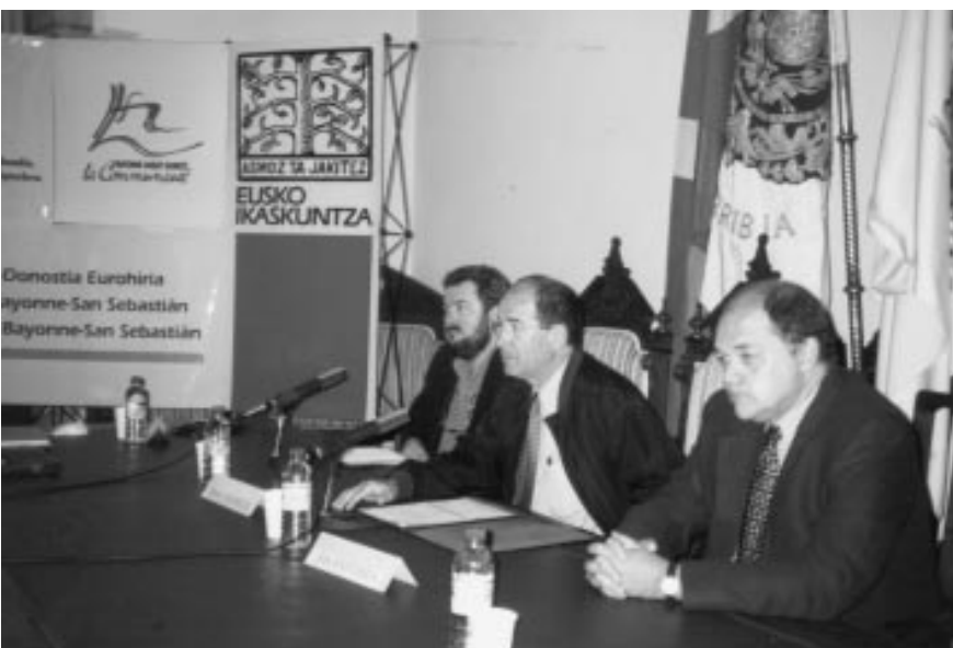
La mairie de Hondarribia accueille une journée sur le futur transfrontalier du Pays Basque.

urrian Bidarten hasi zenetik, Donostia, Angelu eta Miarritzen ere garatu dira programa honen saioak, Hondarribikoarekin itxiera eman zaiolarik. Lan osoaren emaitza, Eusko Ikaskuntzaren XV. Kongresuaren barruan azalduko da, “Ezaguerearen gizartea eta Eukal Herria” sailean.