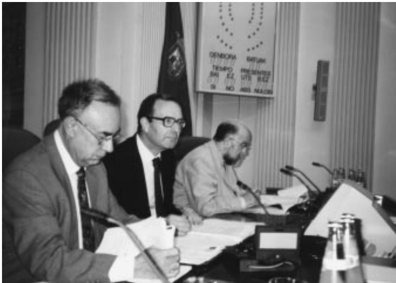
Batzar Iraunkorren Batzorde Akademikoa Gasteizen bilduzen uztailaren 6an.

Por otra parte, la reunión que la Comisión Académica de la Junta Permanente tenía prevista celebrar en el mes de Setiembre en la Diputación de Bizkaia ha sido pospuesta al 26 de octubre.