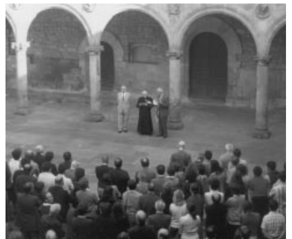
José Miguel de Barandiaran dando la bienvenida a los socios en el claustro de la Universidad de Oñati el 17 de septiembre de 1978.