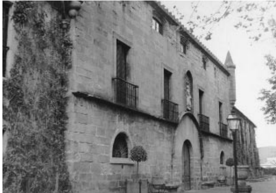
Zarautz, Palacio de Narros.

argazki gehien biltzea helburu, Eusko Ikaskuntzak eta Zarautzko Udalak udalerriko elkarte, kolektibo eta auzokideei zuzenduriko kanpaina bat abiarazi behar dute laster. Eusko Ikaskuntzak digitalizatu, katalogatu eta sailkatuko ditu fondo pribatu horiek. Lana amaituta fondoak jabeen itzuliko zaizkie. Material guzti horiek datu base informatizatu batera bilduko dira, Udal Liburutegian kokatuko dena eta jendeak irispidean izango duena. Modu horretara bideratuko zaio interesaturiko jendeari Zarautzko historiaren hainbat alderditara iristea eta kontsultatzea, eta aldi berean argazki fondo horiek geroko belaunaldientzat babestea bermatuko da.